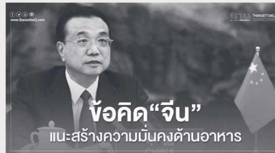
ภาพที่ 3 นายหลี่ เค่อเฉียง นายกรัฐมนตรีจีน กล่าวถึงความมั่นคงด้านอาหารในการประชุมอาเซียนบวกสาม

นายหลี่ เค่อเฉียง นายกรัฐมนตรีจีน ได้กล่าวเน้นในช่วงท้ายของการแถลงต่อที่ประชุมอาเซียนบวกสาม (ASEAN PLUS THREE: APT) วาระพิเศษ ว่าด้วยโรคติดเชื้อไวรัสโคโรนา 2019 (โควิด-19) เมื่อวันที่ 14 เมษายน พ.ศ. 2563 ความว่า ภูมิภาคนี้เป็นหนึ่งในผู้ผลิตธัญพืชรายใหญ่ของโลก และเป็นที่ตั้งของประชากรกว่าหนึ่งในสี่ของโลก และส่วนใหญ่เป็นประเทศกำลังพัฒนา ดังนั้น การสร้างความมั่นคงด้านอาหารจึงเป็นสิ่งสำคัญอย่างยิ่ง โดยต้องใช้ประโยชน์อย่างเต็มที่จากองค์กรสำรองข้าวฉุกเฉินของอาเซียนบวกสาม (ASEAN PLUS THREE EMERGENCY RICE RESERVE: APTERR) เพื่อป้องกันวิกฤตด้านอาหาร