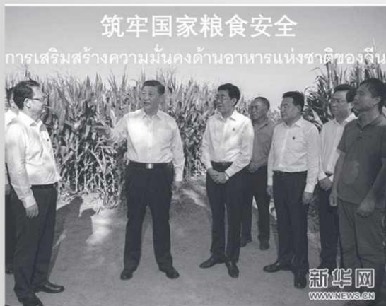
ภาพที่ 2 นายสี จิ้นผิง ในฐานะเลขาธิการ คณะกรรมการกลางพรรคคอมมิวนิสต์จีน ประธานาธิบดีแห่งรัฐและประธานคณะกรรมการกลาง เดินทางไปเยือนบมกสจีหลิน ในระหว่างวันที่ 22 - 24 กรกฎาคม พ.ศ. 2563 เพื่อส่งเสริมความทันสมัยของการเกษตรและพื้นที่ชนบทโดยการสนับสนุนทางวิทยาศาสตร์และเทคโนโลยี ที่มีความสำคัญอย่างยิ่งต่อการผลิตธัญพืช อันเป็นหลักประกันความมั่นคงด้านอาหารแห่งชาติของจีน

3 ระบบ” ของการเกษตรสมัยใหม่ (ได้แก่ ระบบการเกษตรด้วยวิทยาศาสตร์เทคโนโลยีที่ทันสมัย ระบบการพัฒนาพื้นที่หมู่บ้านชนบทด้วยโครงสร้างพื้นฐาน และระบบการยกระดับชีวิตความเป็นอยู่ของเกษตรกร) รวมทั้งดำเนินการป้องกันดินด่างในเชิงลึกและเร่งการสร้างพื้นที่เพาะปลูกที่มีมาตรฐานสูง ตลอดจนปรับปรุงกำลังการผลิตธัญพืชโดยรวม และสนับสนุนความแข็งแกร่งของมณฑลจีหลินในการปกป้องความมั่นคงด้านอาหารของชาติ