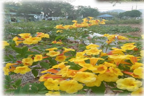
หลังดำเนินการ