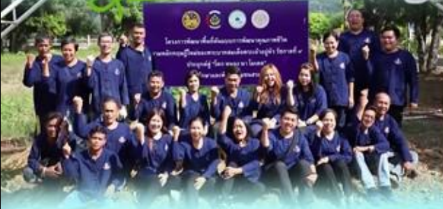
มิตรภาพเริ่มต้นที่ @ศพช.สระบุรี