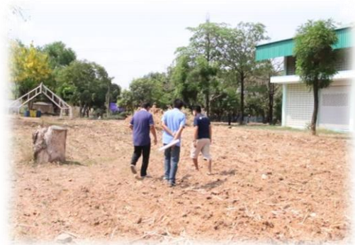
ก่อนดำเนินการ (สำรวจ ออกแบบ)